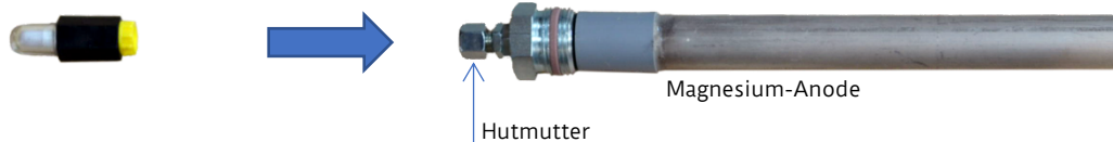
Farbkapsel / Verbrauchsanzeige